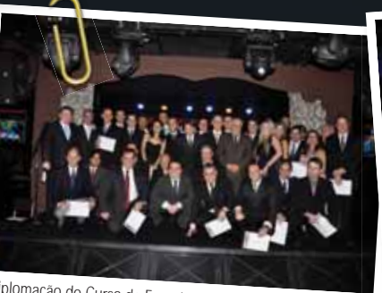
Diplomação do Curso de Especialização em Cir. Endovascular