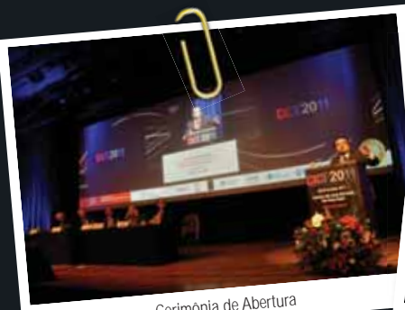
Cerimônia de Abertura