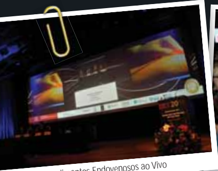
Procedimentos Endovenosos ao Vivo