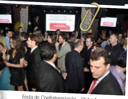
Festa de Confraternização - Clube A