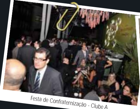
Festa de Confraternização - Clube A