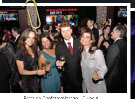
Festa de Confraternização - Clube A