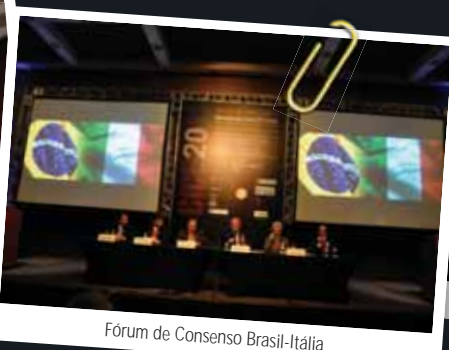
Fórum de Consenso Brasil-Itália