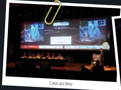
Caso ao Vivo