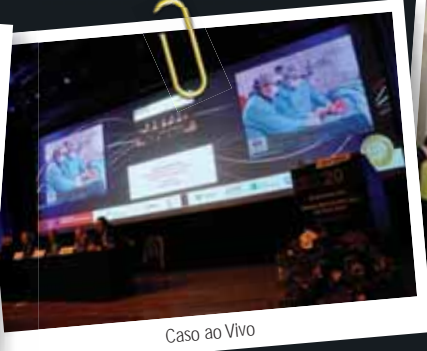
Caso ao Vivo